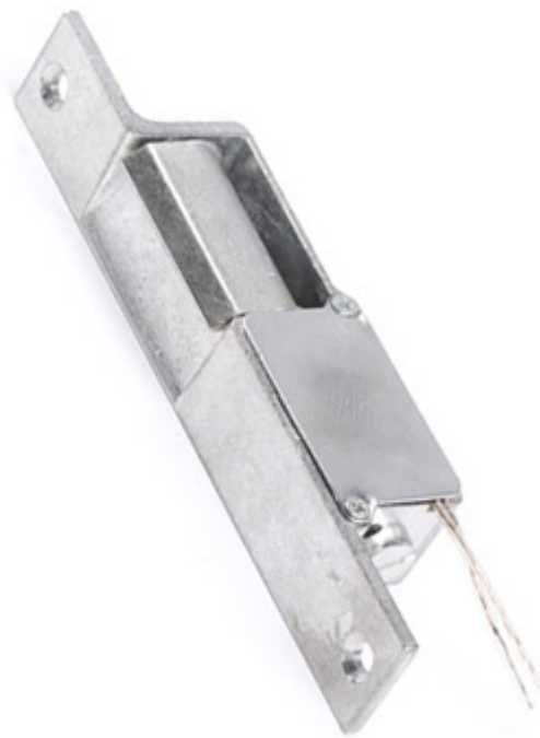
Wymiary i zdjęcie zaczeu